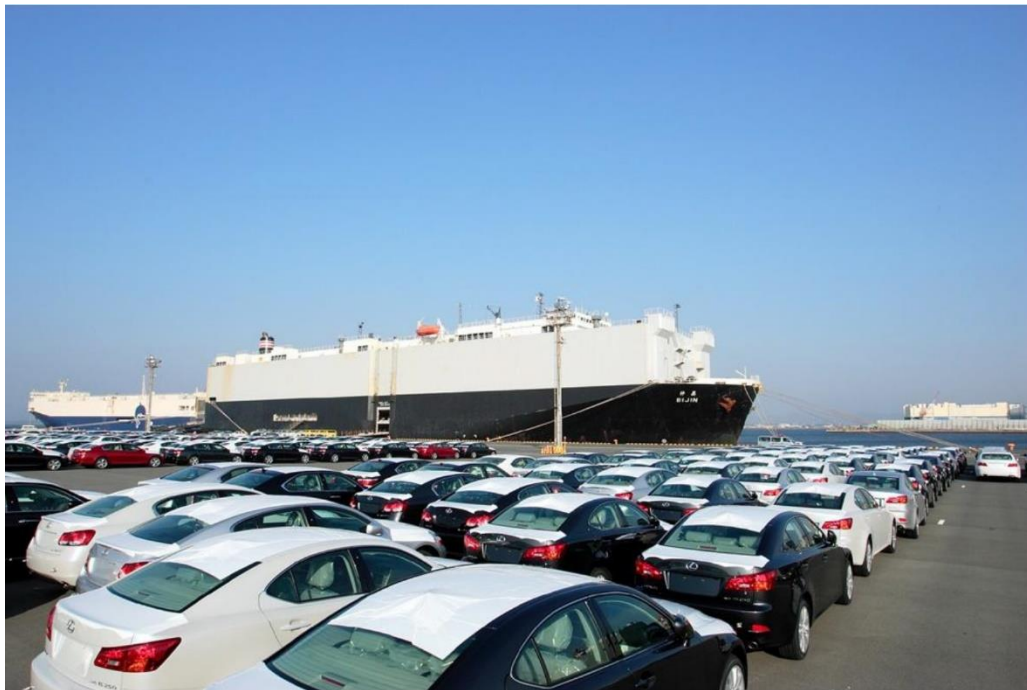
საექსპორტოდ გამზადებული ავტომანქანები