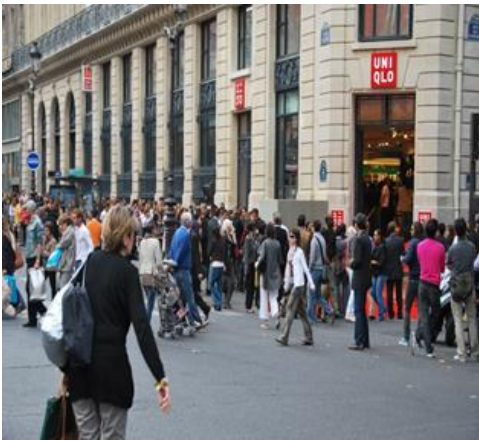
UNIQLO ფართოვდება საზღვარგარეთაც (UNIQLO-ს მაღაზია პარიზში)

1950-იანი წლებიდან შეიცვალა ექსპორტის შემადგენლობა და ტექსტილიდან და მსუბუქი მრეწველობის პროდუქტიდან მძიმე მრეწველობის საქონელზე გადავიდა. 1970-იან წლებიდან